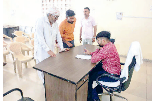
महेंद्रगढ़। एसडीएम योगेश सैनी ने मंगलवार को सतनाली खंड कार्यालय में समाधान शिविर लगाकर नागरिकों की समस्याएं सुनीं और मौके पर उपस्थित अधिकारियों को समाधान बारे निर्देश दिए। एसडीएम योगेश सैनी ने कहा कि अधिकारी आमजन की सभी शिकायतों को गंभीरता से लें और इनका समयबद्ध निपटारा करना सुनिश्चित करें। उन्होंने कहा कि शिकायतों का तत्परता से समाधान करते हुए शिकायतकर्ता को राहत पहुंचाने में विभागीय अधिकारी सजगता दिखाएं। समस्याओं का समाधान करके आमजन का जीवन सरल बनाया जाए। उन्होंने अधिकारियों को निर्देश दिए कि जिस भी विभाग की पुरानी शिकायतें लंबित हैं उनका शीघ्र समाधान करवाना सुनिश्चित करें और इसकी रिपोर्ट भी प्रस्तुत करें। इस अवसर पर विभिन्न विभागों के अधिकारी भी मौजूद रहे।