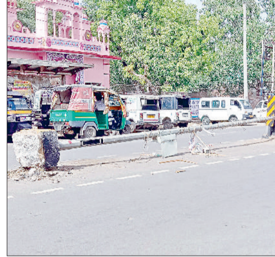
नारनौल। एडीसी कार्यालय गेट के सामने उखड़ा पड़ा स्ट्रीट लाइट का पोल, पुल बाजार के पास अंधड़ में झुका पोल।

गर्मियों की शुरुआत में ही सोमवार शाम आई तेज आंधी और हल्की बारिश ने शहर की बिजली व्यवस्था की तैयारियों की पोल खोलकर रख दी। मौसम के अचानक बदले मिजाज के चलते तेज हवाओं के साथ आई आंधी ने शहर के कई हिस्सों में पेड़ और बिजली के खंभे गिरा दिए, जिससे विद्युत आपूर्ति पूरी तरह ठप हो गई। इस अंधड़ में पेड़ों एवं पशियों को भी नुकसान पहुंचा। हालात ऐसे बने कि अधिकांश शहर रात करीब 11 बजे तक अंधेरे में डूबा रहा और लोगों को भीषण गर्मी व उमस के बीच भारी परेशानियों का सामना करना पड़ा। इससे जनजीवन अस्त-व्यस्त हो गया।