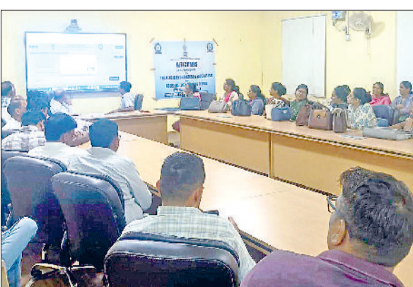
महेंद्रगढ़। प्रशिक्षण लेते कॉलेज के स्टाफ सदस्य।