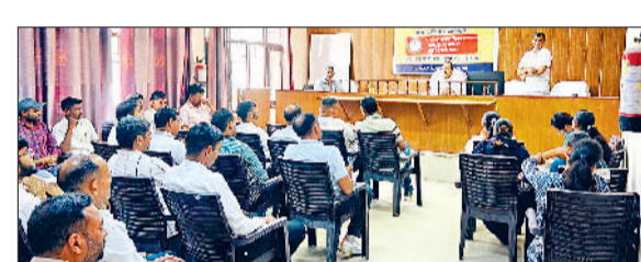
महेंद्रगढ़। कर्मचारियों की बैठक लेते हुए।