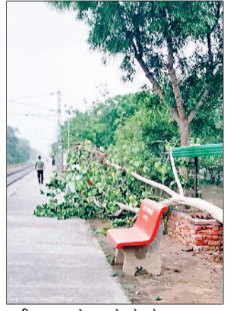
कनीना। गुड़ा केमला रेलवे स्टेशन पर आंधी से गिरे पेड़।

रेवाड़ी बीकानेर रेल मार्ग के अंतर्गत गुड़ा केमला रेलवे स्टेशन प्लेटफार्म पर पीपल का पेड़ तेज आंधी से गिर गया। वर्षों पुराना पीपल का पेड़ गिरने से पेयजल के लिए बनाया गया टीनशेड भी क्षतिग्रस्त हो गया। गनीमत रही कि इस दौरान कोई जनहानि नहीं हुई। स्थानीय लोगों व रेल कर्मचारियों ने इसे बड़ी राहत बताया। दिन के समय यहां यात्रियों की आवाजाही रहती है। पेड़ की शाखाओं के कारण प्लेटफार्म का रास्ता अवरुद्ध हो गया, जिसे सुबह के समय ग्रामीणों ने हटाकर साइड में किया।